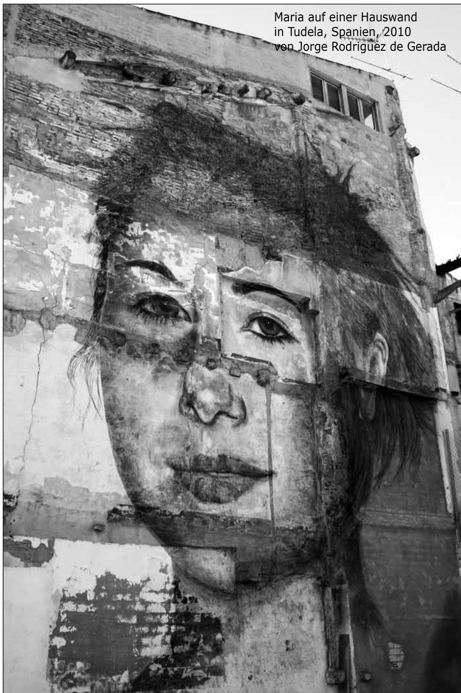
Maria auf einer Hauswand in Tudela, Spanien, 2010 von Jorge Rodríguez de Gerada

„Aber es ist komplett legal. Das Gesetz ist auf meiner Seite. Sie hatten mir gegenüber immer folgende Strategie: Wenn sie mich anklagen, kostet es mich 200'000 Dollar, um mich mit einem guten Anwalt bewehren und zurückschlagen zu können. Kein Künstler hat soviel Geld. Sie würden mich derart herunterputzen, dass ich es nie mehr tun würde. Ich würde eine Verurteilung auch nicht weiterziehen können, aus finanziellen Gründen. Aber das Gute ist: Wenn man in New York lebt, kann man die Dienste der „Volunteer Lawyers for the Arts“ in Anspruch nehmen. Wenn sie sehen,