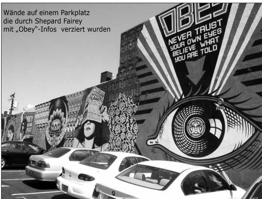
Wände auf einem Parkplatz die durch Shepard Fairey mit „Obey“-Infos verziert wurden

„Obey“- sowie das „This is Your God“-Zitat (In diesem John-Carpenter-Film kommt der Hauptdarsteller in den Besitz einer Sonnenbrille, durch die er die wahre Bedeutung hinter der scheinbaren Realität erkennen kann: Manipulative Botschaften von Ausserirdischen! Werbeplakate und Zeitschriften beinhalten nur noch Befehle wie „Gehorche!“, „Konsumiere!“, „Schlafe weiter!“ oder „Sieh fern!“, auf Geldscheinen steht „Dies ist dein Gott!“, in einer Zeitschrift sind die Worte „Stelle keine Autoritäten in Frage!“ zu lesen.)