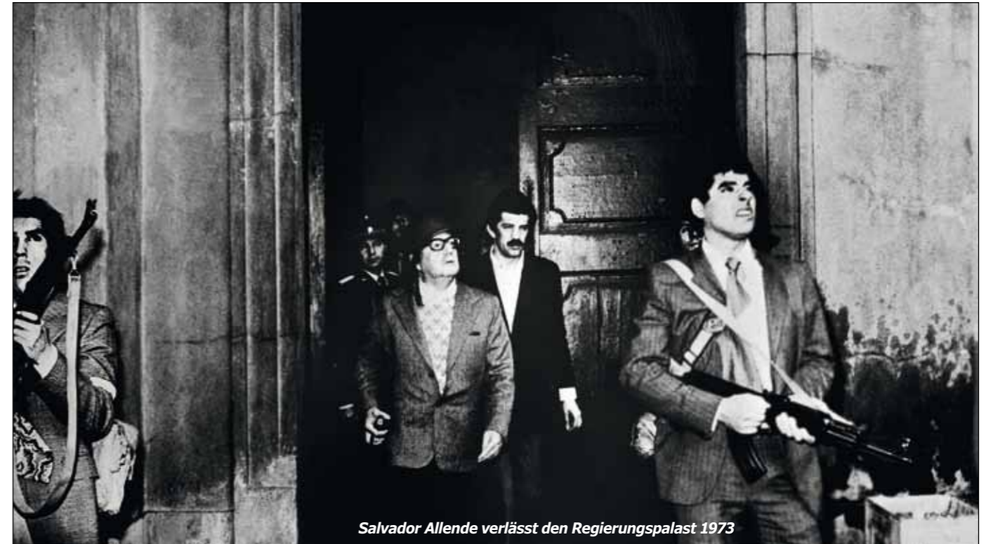
Salvador Allende verlässt den Regierungspalast 1973