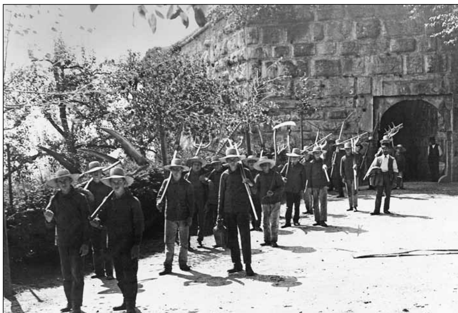
Seite 75, Abb. 3: Auszug zum Heuet, um 1910.

Die Studie Heinigers wirft auch ein Schlaglicht auf den politischen Filz des Bürgertums vor 1970. Wer wollte schon einem Partei- oder Offizierkollegen wehtun? Einzelne besonders drastische Missstände wurden zwar angeprangert, manchmal sogar öffentlich, deren Behebung dauerte aber oft Jahre, ja Jahrzehnte (zum Beispiel Installation elektrisches Licht). Es fehlte nicht an Mut: ein sensibler reformierter Anstaltsgeistlicher beispielsweise verstand sich als Anwalt der Gequälten, hatte stets ein offenes Ohr, führte beinahe schon therapeutisch zu nennende