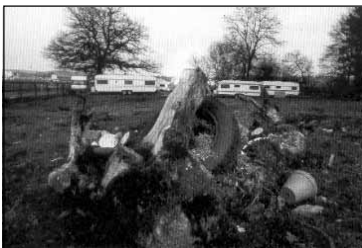
Foto von Urs Walder, aus dem Buch: Nomaden in der Schweiz. Standplatz in Kloten.

einfach, denn diejenigen die das Reisen nicht mehr kennen, sind sich der Probleme