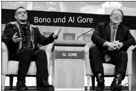
Bono und Al Gore

nie. Doch gab es zu allen Zeiten immer Menschen, denen das nicht egal war. Menschen, die halfen, weil sie die Mittel (sprich: die nötigen Finanzen) dazu hatten. Sie spendeten für Notleidende. Investierten in von ihnen organisierte Wohlfahrtsverbände. Zunächst eher im eignen Lande. Später wurde dann auch Hilfe für Notleidende im Ausland ins Werk gesetzt.