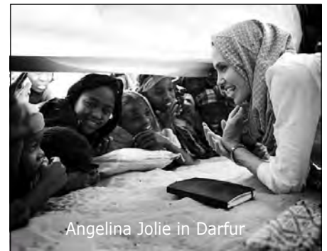
Angelina Jolie in Darfur