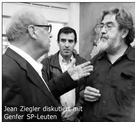
Jean Ziegler diskutiert mit Genfer SP-Leuten

Nämlich, dass es nicht weniger als eine große Schande ist, dass Menschen auf dieser unserer Erde noch immer Hunger leiden müssen. Darunter viele Kinder. Sekündlich sterben sie! Sekündlich! Im übertragenen Sinne sterben sie geradezu wie die Fliegen, die sich auf den Müll-