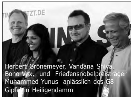
Herbert Grönemeyer, Vandana Shiva, Bono Vpx, und Friedensnobelpreisträger Muhammed Yunus anlässlich des G8 Gipfels in Heiligendamm

In Zeiten einer zunehmenden Boulevardisierung und der damit einhergehenden