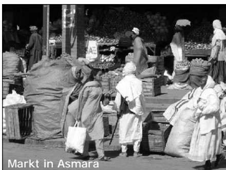
Markt in Asmara

Die Bevölkerung setzt sich aus neun sehr verschiedenen ethnischen Gruppen zu-