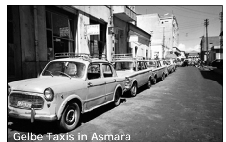
Gelbe Taxis in Asmara

Kaisern unterstand, herrschten in den Küstengegenden lokale Fürsten und die Osmanen.