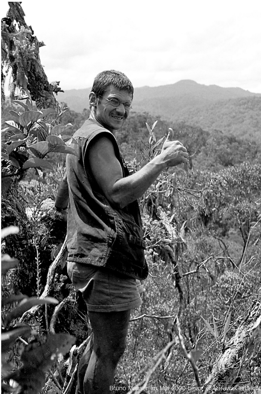
Bruno Manser im Mai 2000 bevor er Sarawak erreicht

mn. Die Penan, eines der verbliebenen 400 Urvölker Borneos, stehen stellvertretend für den scheinbar aussichtslosen Kampf nomadischer Jäger und Sammler gegen die Ausbeutung und Zerstörung ihrer Lebensgrundlage durch Regierung und Industrie. Die Situation der Wald-Nomaden ist elend. Das Wild verschwindet, die Flüsse sind verschmutzt und mit dem verdreckten Wasser kann das Hauptnahrungsmittel Sago nicht mehr zubereitet werden. Unterernährung und Krankheiten nehmen zu. Der Bruno-Manser-Fonds (bmf) versucht seit dem „Verschwinden“ von Bruno Manser zu helfen. Es braucht Geld (z.B. für Anwaltskosten, Prozesse, Kautionen für inhaftierte Ureinwohner, etc.) und Interventionen auf politischer Ebene. Ich habe den bmf kurz gefragt wo sie um den Jahreswechsel stehen.