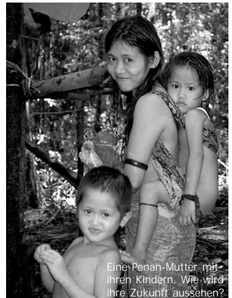
Eine Penan-Mutter mit ihren Kindern. Wie wird ihre Zukunft aussehen?